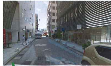
EV降りて道路の右側