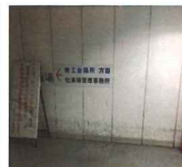
突き当りを左側へ